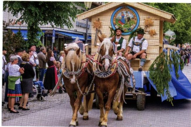
Unser Festwagen zur Landesausstellung 2018