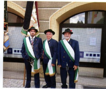
Fahnenabordnung im forstgrünen Anzug