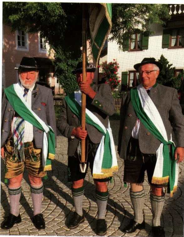
Fahnenabordnung mit kurzer Lederhose