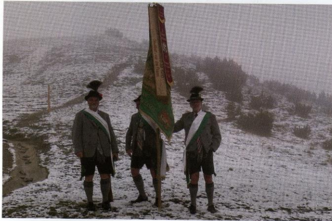
Das 135-jährige Jubiläum mit den Werdenfeller Vereinen wurde am Wank mit einer Bergmesse gefeiert.