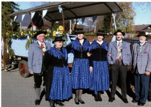
Leonhardifahrt in Garmisch-Partenkirchen 2022