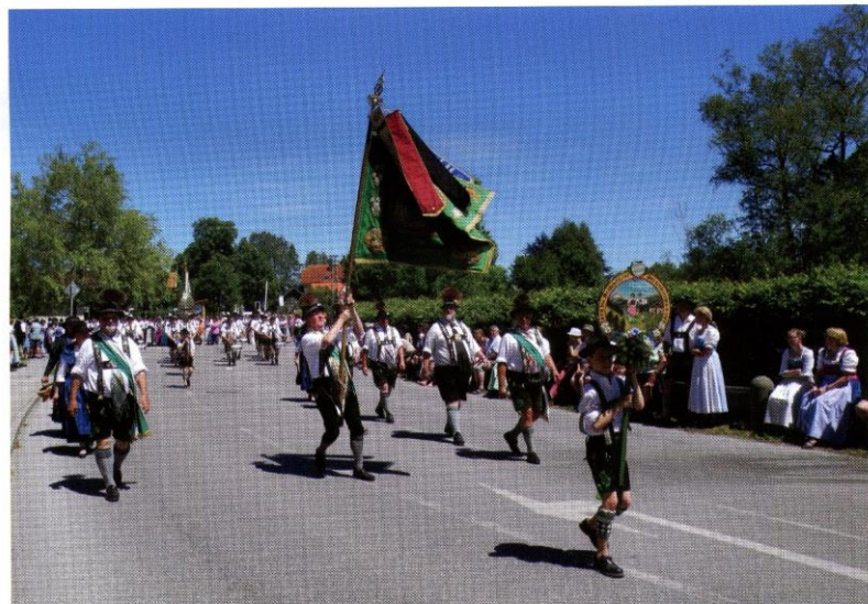
Gaufest in Uffing