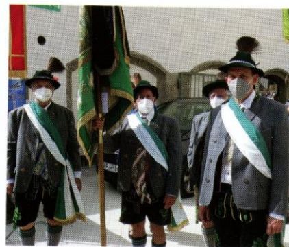
Fahnenabordnung während Corona