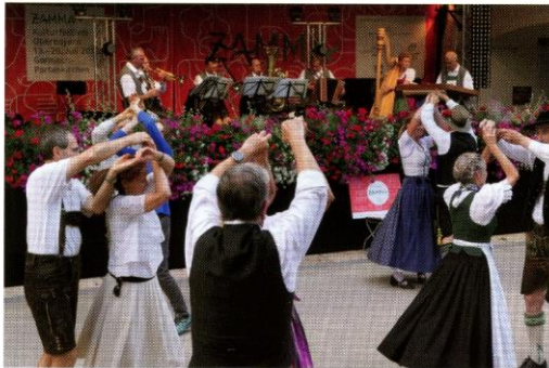
Volkstanz im Park 2019