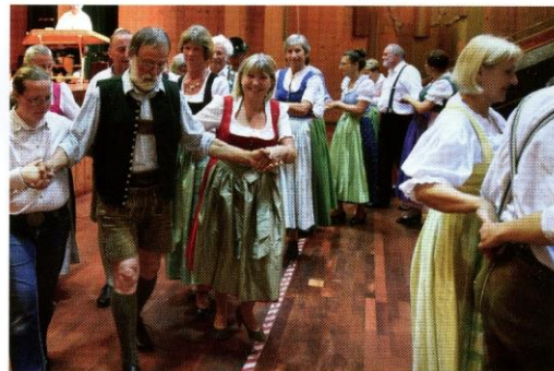
Volkstanz im Festsaal Werdenfels