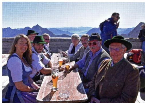
Vereinsausflug auf die Zugspitze