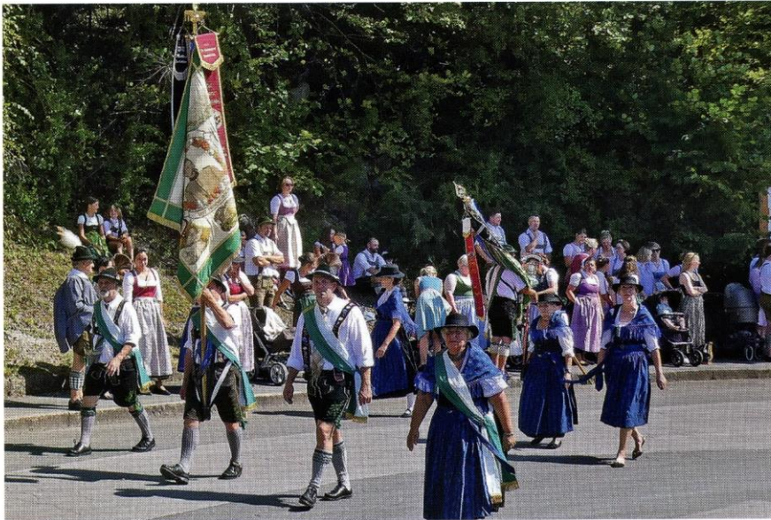
Gaufest in Partenkirchen